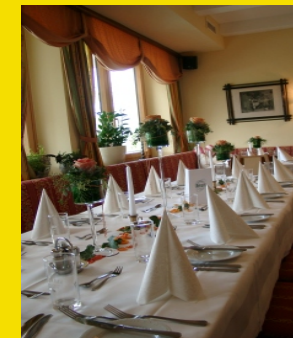
Romantikstüberl mit offenem Kamin und Blick auf Linz bis 30 Personen

mit Zugang zu unserer Panoramaterrasse und Blick auf Linz bis 55 Personen