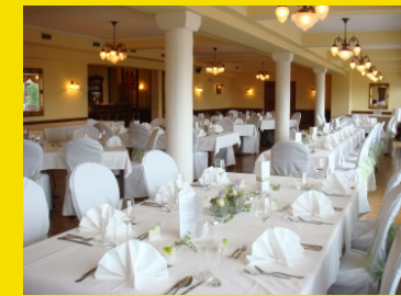
Festsaal Urfahr mit eigener Panoramaterrasse 60-180 Personen

Bei Buffet- und Getränkepauschalen: Kinder bis 4 Jahre feiern bei uns gratis. Von 4 - 10 Jahre erhalten sie 50% Ermäßigung.