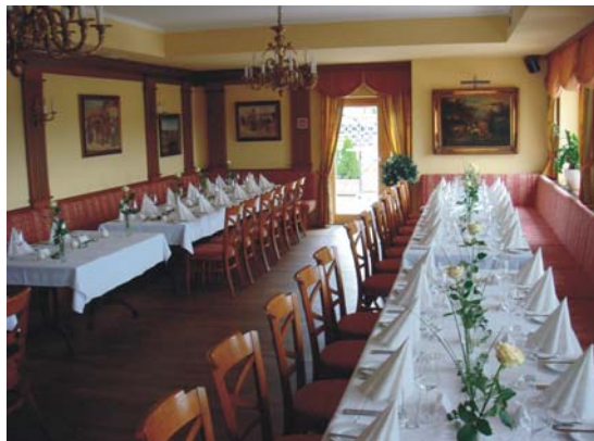
Raum Magdalena mit Zugang zu unserer Panoramaterrasse und Blick auf Linz bis 55 Personen