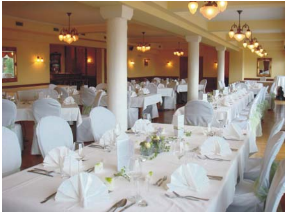
Festsaal Urfahr mit eigener Panoramaterrasse 60-180 Personen