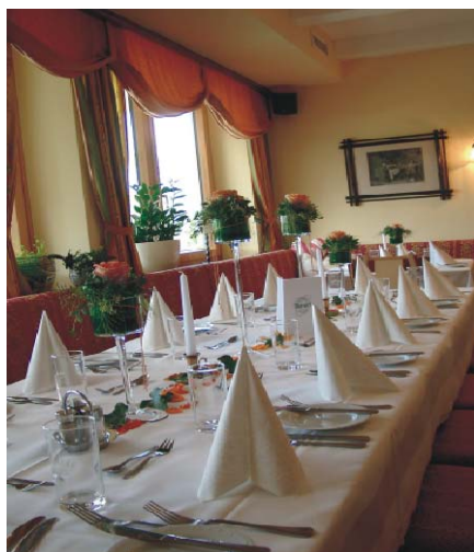
Romantikstüberl mit offenem Kamin und Blick auf Linz bis 30 Personen